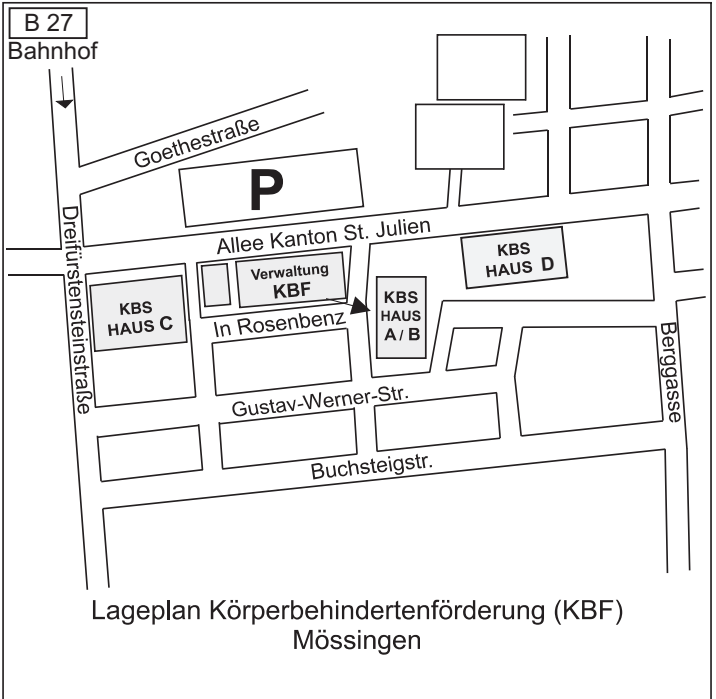
Lageplan Körperbehindertenförderung (KBF) Mössingen